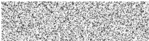
Jakub Švec vedoucí oblasti TFM, na základě plné moci Kaufland Česká republika v.o.s.