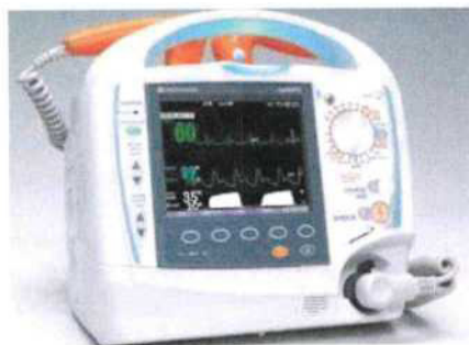
Obr.: ilustrační foto - Bifázický defibrilátor řady TEC-5631