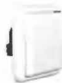
Dry Contact Receiver RTS (vysílač 1-kanál)