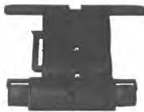
bezpečnostní článkový závěs LOCK to Play