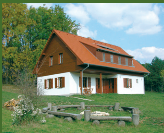
Chata Jagdhütte Bulhary