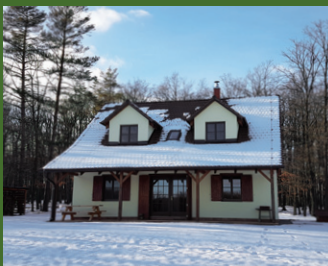
Chata Diana Jagdhütte Diana Moravský Krumlov