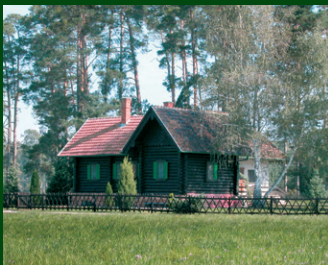
Chata Jagdhütte Dubravka