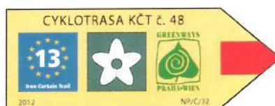
směrovka pásového značení