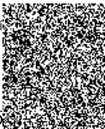
Bc. D. vedoucí OMM