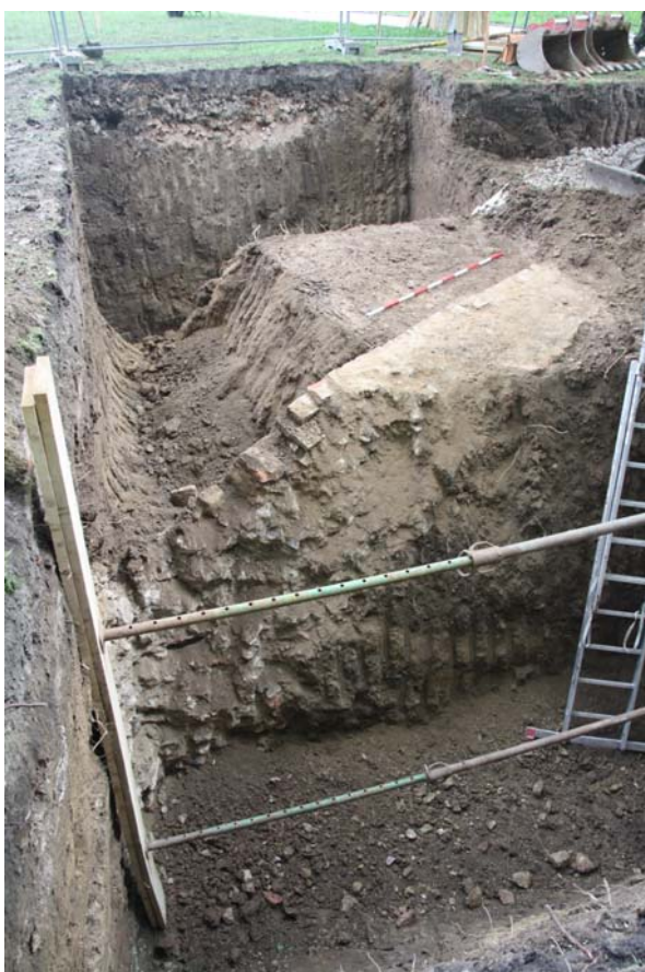
Nahoře – pohled na zdivo eskarpy od JV; dole – pohled od západu.