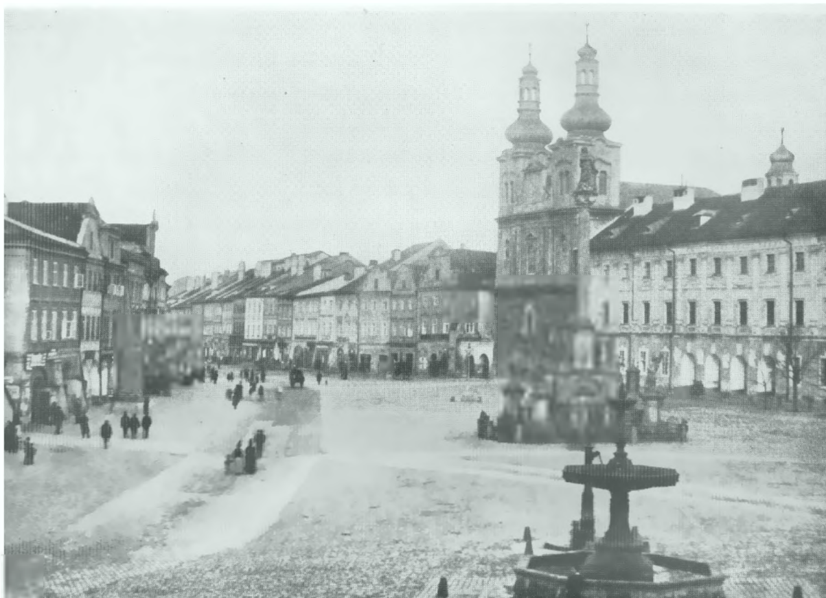
Obrázek 2 Fotografie podoby kašny z konce 19. století převzata ze studie Živé náměstí, revitalizace Velkého náměstí v Hradci Králové, s vyznačením nového vodního prvku, který bude předmětem soutěže, autor: ARN studio spol. s r.o.- architekti Chmelík & partneři s.r.o, 2023 (původní zdroj neuveden)

Studie je projednána s klíčovými dotčenými orgány, mimo jiné i s orgány památkové péče. Statutární město Hradec Králové se rozhodlo hledat podobu nového vodního prvku v architektonicko-výtvarné soutěži.