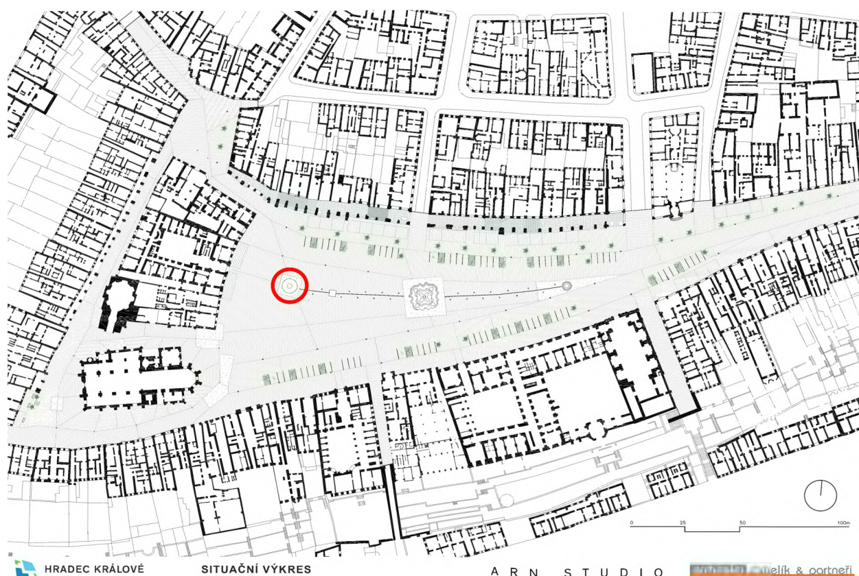
Obrázek 1, Situace ze studie Živé náměstí, revitalizace Velkého náměstí v Hradci Králové, s vyznačením nového vodního prvku, který bude předmětem soutěže, autor: ARN studio spol. s r.o.- architekti Chmelík & partneři s.r.o, 2023