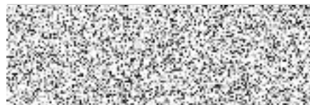
razítko a podpis pojistitele