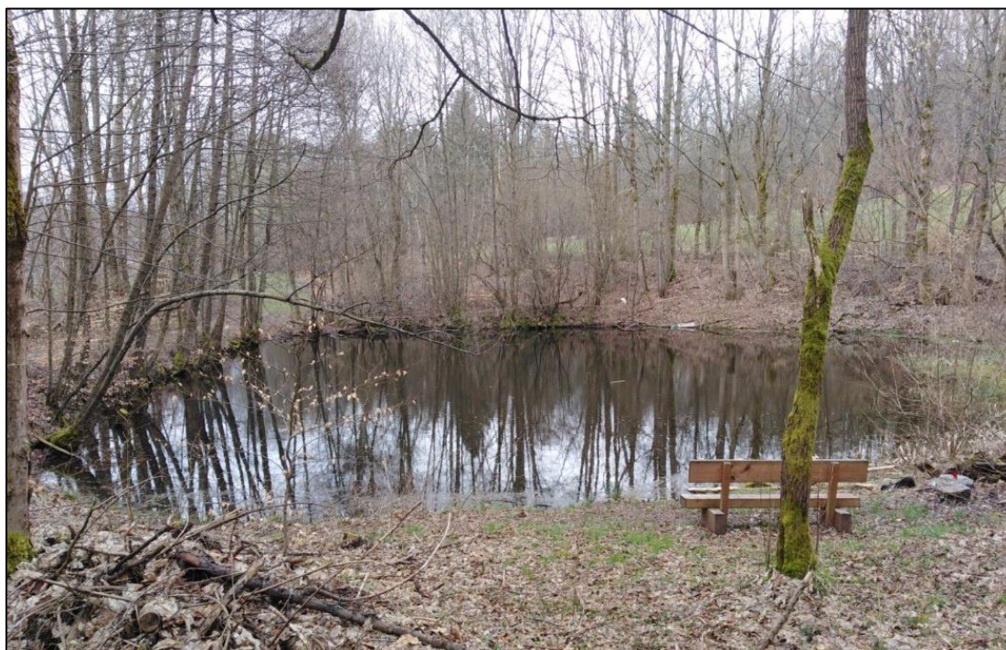
Obrázek 1 - Stav hráze.