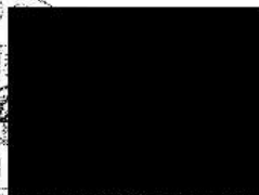
Olomoucký kraj Mgr. Jiří Zemánek 1. náměstek hejtmána Olomouckého kraje