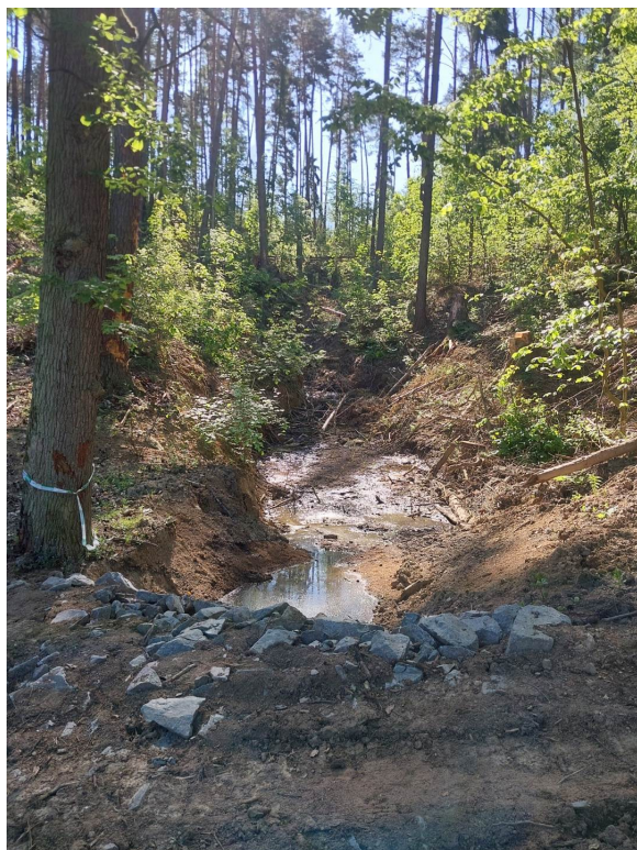
Předpokládané umístění přehrážky č.2