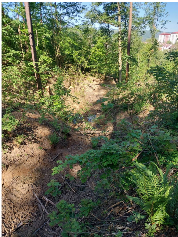
Předpokládané umístění přehrážky č.1