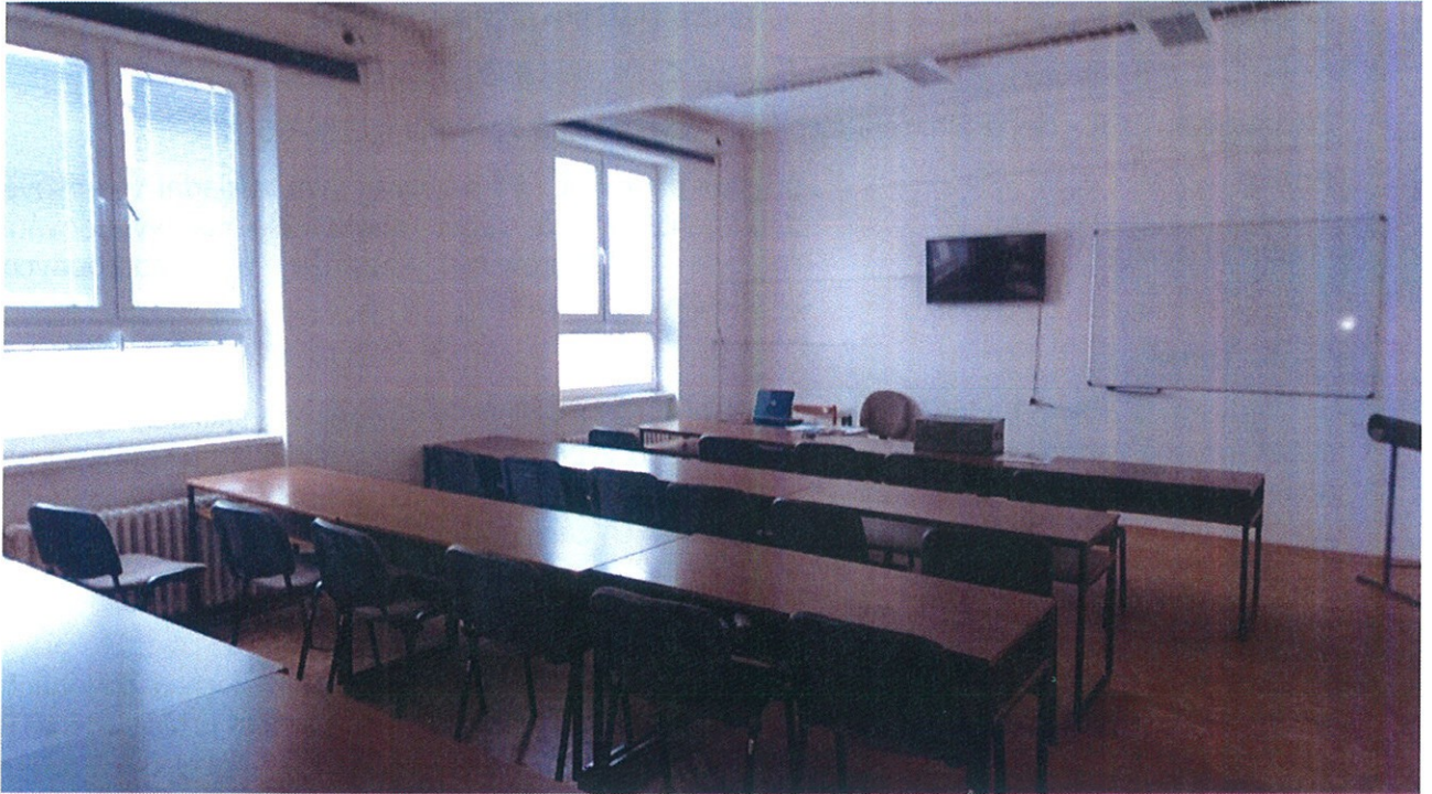
Obr. 3 – Učebna – lišty s kabeláží budou pod parapetem, zásuvky nad lištou