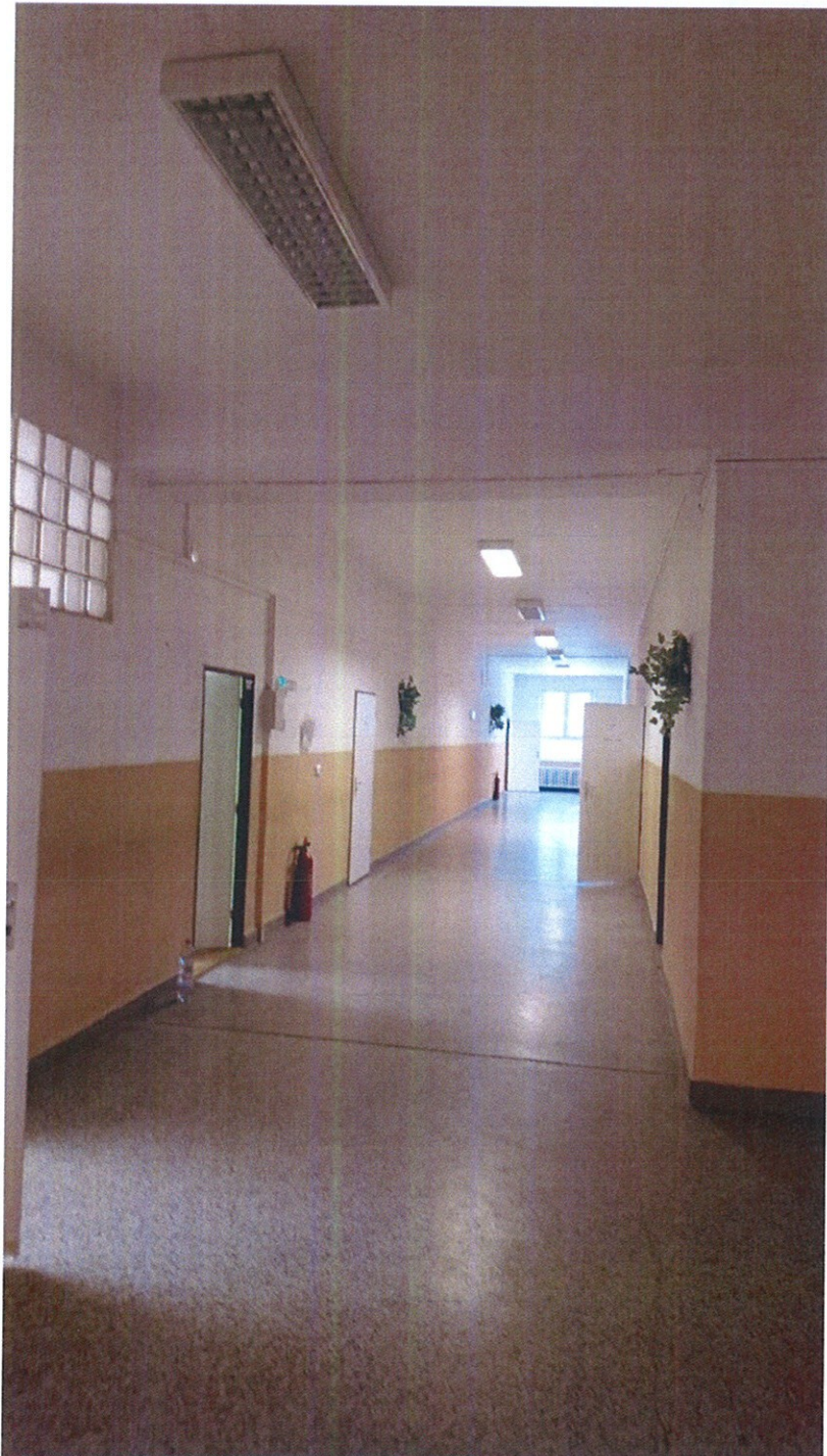
Obr. 2 – Chodba – lišty s kabeláží budou u stropu