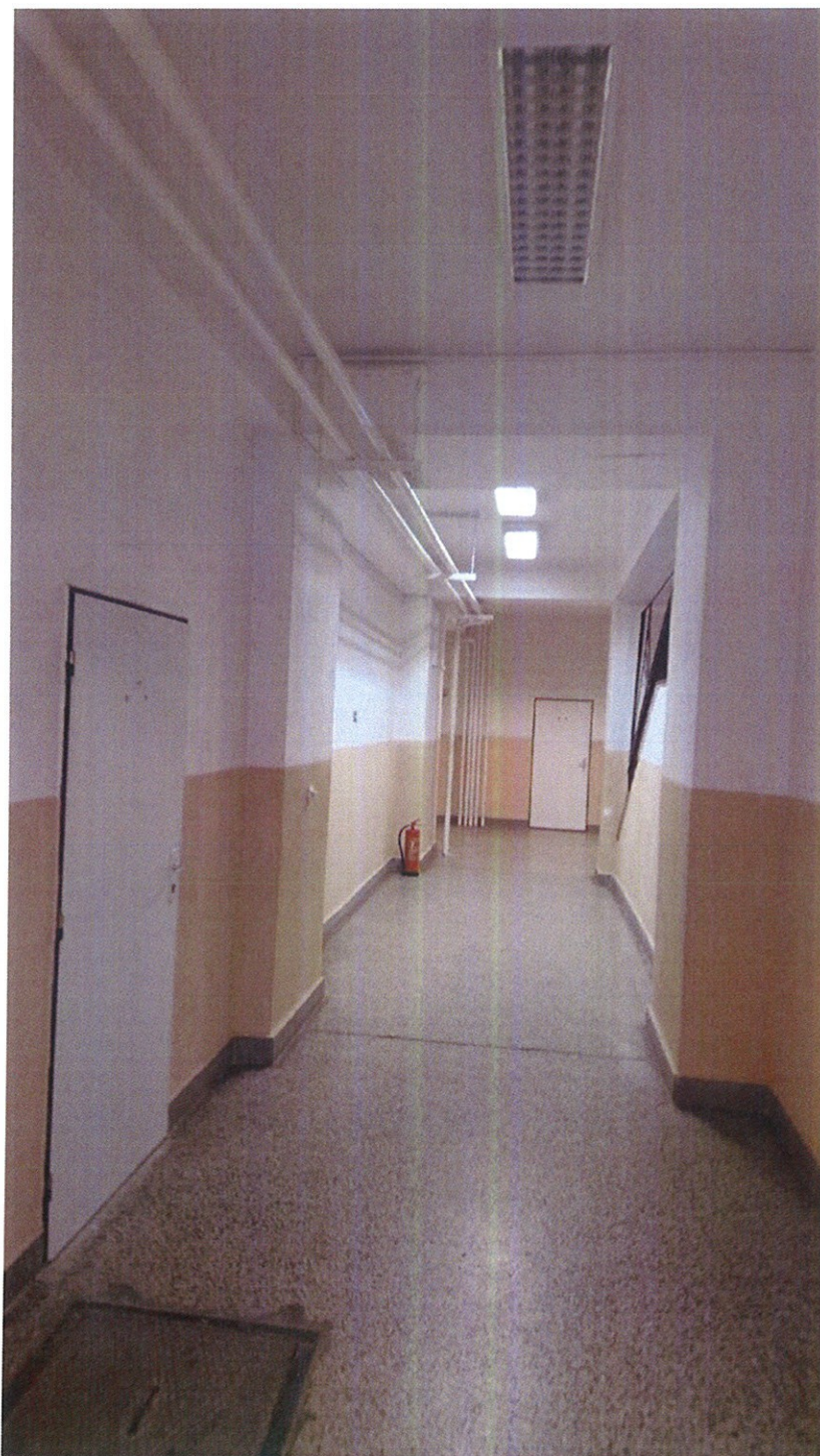
Obr. 1 – Chodba – lišty s kabeláží budou u stropu

Schématický nákres přízemí s vyznačením umístění zásuvek je v přiloženém souboru „Z2017-15-PŘÍLOHA-1-přízemí.pdf“. Schématický nákres 1. patra s vyznačením umístění zásuvek je v přiloženém souboru „Z2017-15-PŘÍLOHA-1-1patro.pdf“.