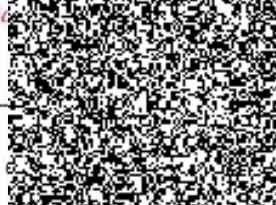
ředitel Odboru bezpečnostní kontroly

Ministerstvo vnitra ČR Odbor bezpečnostní kontroly