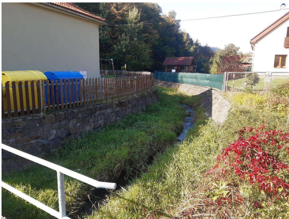
Obr 4. koryto v ř.km 3,2 pohled proti proudu v tvrdé úpravě oboustranná OZ z LK.