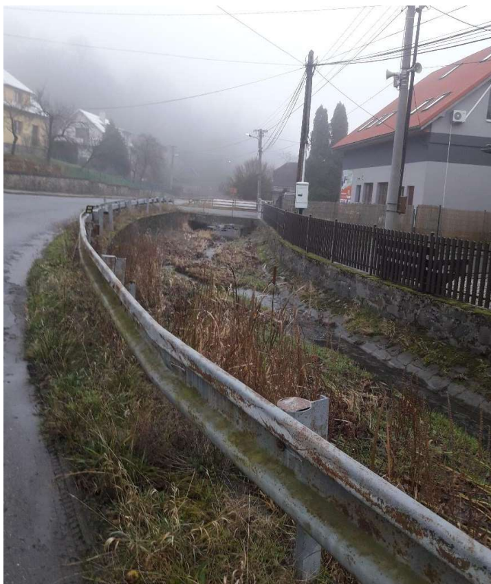
Obr 3. Koryto v ř.km 3-3,1 pohled po proudu. Tvrdá úprava v oboustranných OZ