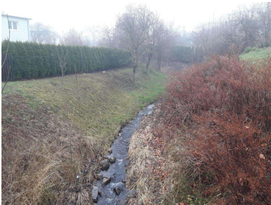
Obr 2. Koryto opevněné rovníciou z LK (PB). ř.km 2,6 pohled proti proudu