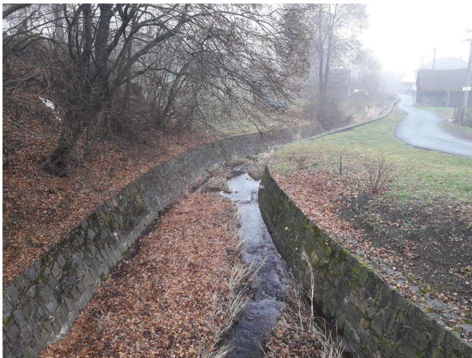
Obr 1 Koryto v oboustranných OZ z LK. Pohled po proudu ř.km 2,6