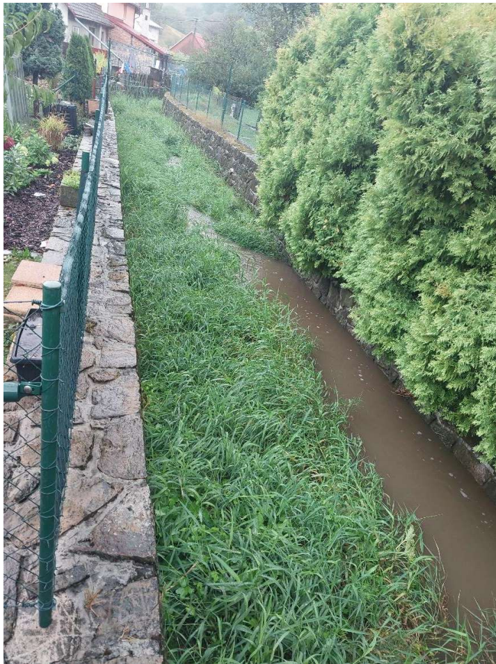
Obr 5. Koryto v ř.km 3,4 pohled po proudu