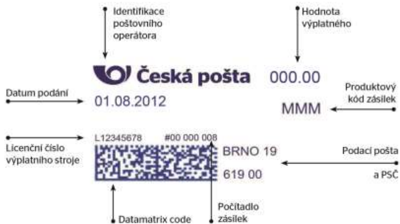
Obr. 2: Rozmístění informací na digitálním otisku