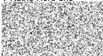
Mgr. Lukáš Seifert starosta města