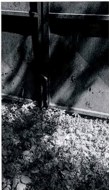
Uchycení ostnatého drátu