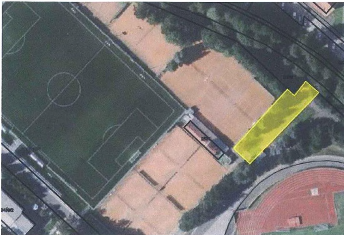
Obr. č.1 – Zájmové území určené pro novostavbu

Záměrem města Sokolov je vybudovat nové zázemí pro tenisový klub v areálu Baník Sokolov.