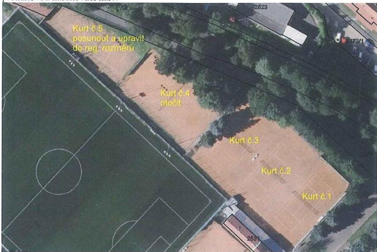
Obr. č.2 – Vyznačení rekonstruovaných kurtů

Záměrem města je provést rekonstrukci tenisových kurtů a na kurty č.1, č.2 a č.3 navrhnout přetlakovou nafukovací halu.