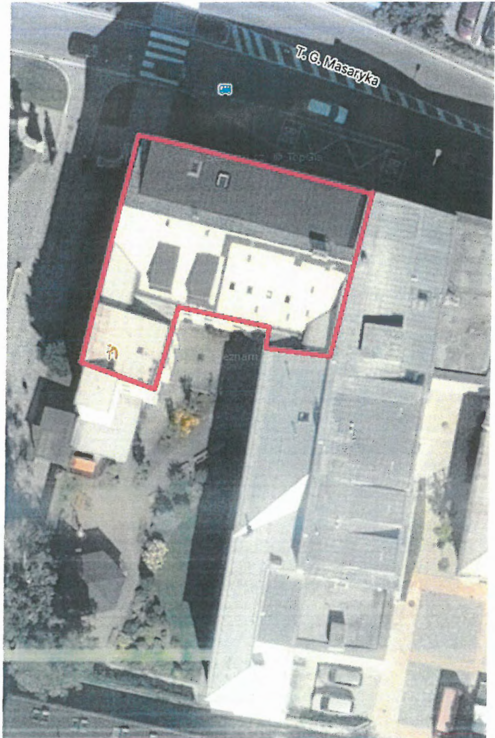
Obr.1 – situace s vyznačením řešených objektů

Předmětem zadání je statické posouzení stávající konstrukce střechy na objektu Seniorcentra na ul. T. G. Masaryka ve Svitavách pro možnost instalace FVE panelů.