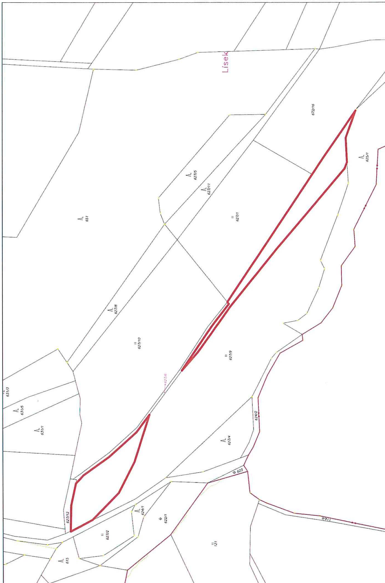
p. č. 627/9 dle KN v k.ú. Ústí u Staré Paky – část 3704 m 2 (červeně vyznačeno)