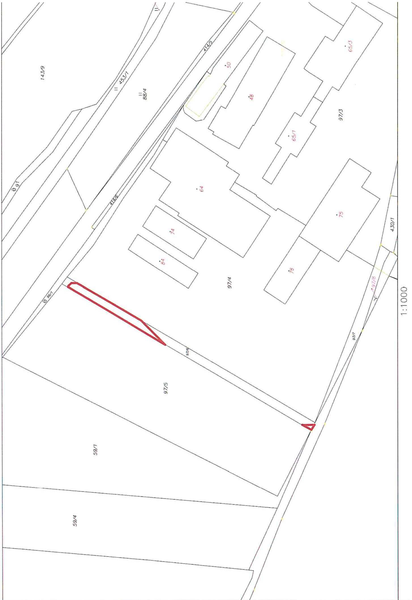
p. č. 97/6 dle KN v k.ú. Radkyně – část 212 m 2 (červeně vyznačeno)