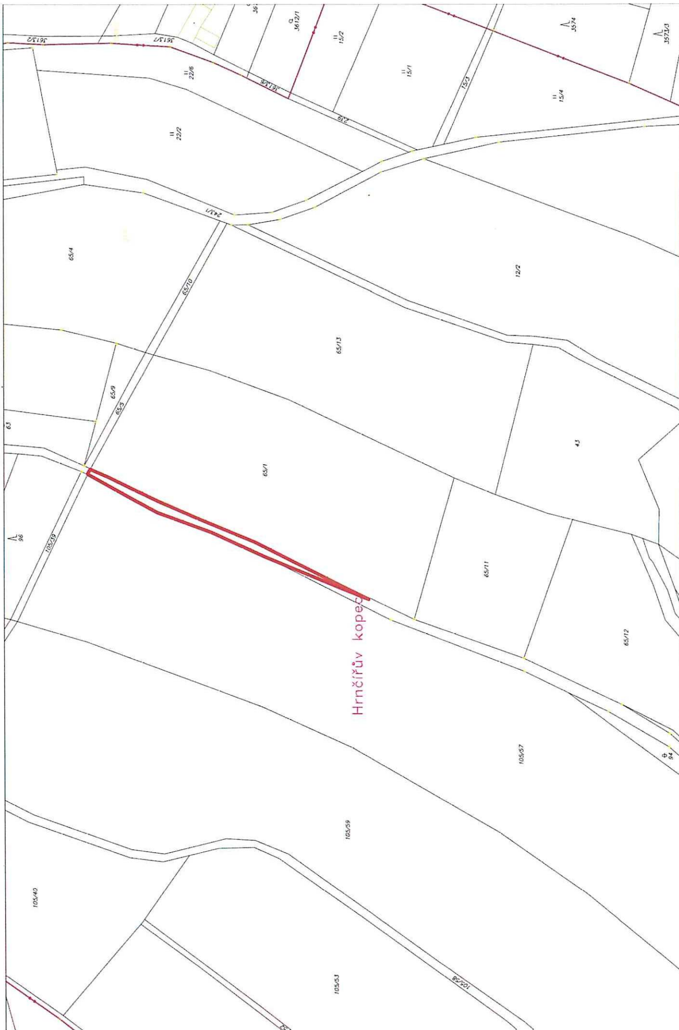
p. č. 245/1 dle KN v k.ú. Studénka u Nové Paky – část 480 m 2 (červeně vyznačeno)