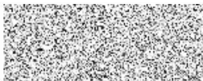
za Zhotovitele Svatopluk Oehm