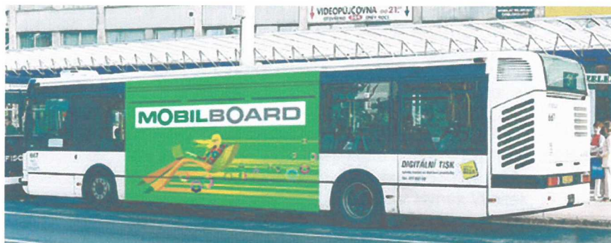
MOBILBOARD rozměry: 450 x 230 cm