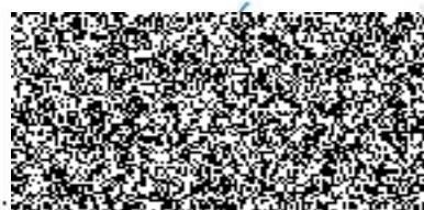
HZS Středočeského kraje objednatel