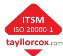
Obrázek 2: Certifikace ICZ a.s.