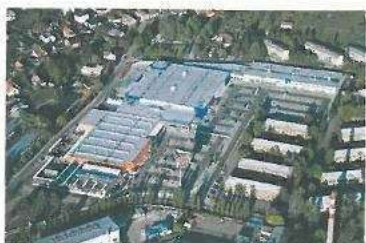
Obchodní centrum Nová Zdobůř Příbram (hypermarkety OBI, TESCO + 3 hypermarkety s prodejními galeriemi)