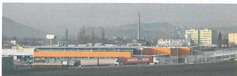
Obchodní centrum OBI Beroun