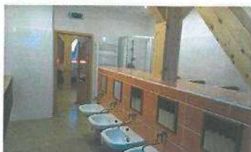
MŠ Pod Sv. Horovou vestavba podkroví