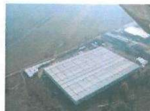
Logistické centrum Michelin Jesenice