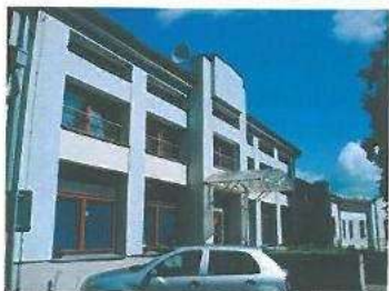
BD na bývalém dole Anna Příbram