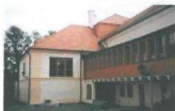
Společenské centrum Rožmitál p. Tř.