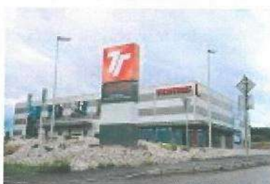
Areál firmy TOMIS CZ Příbram