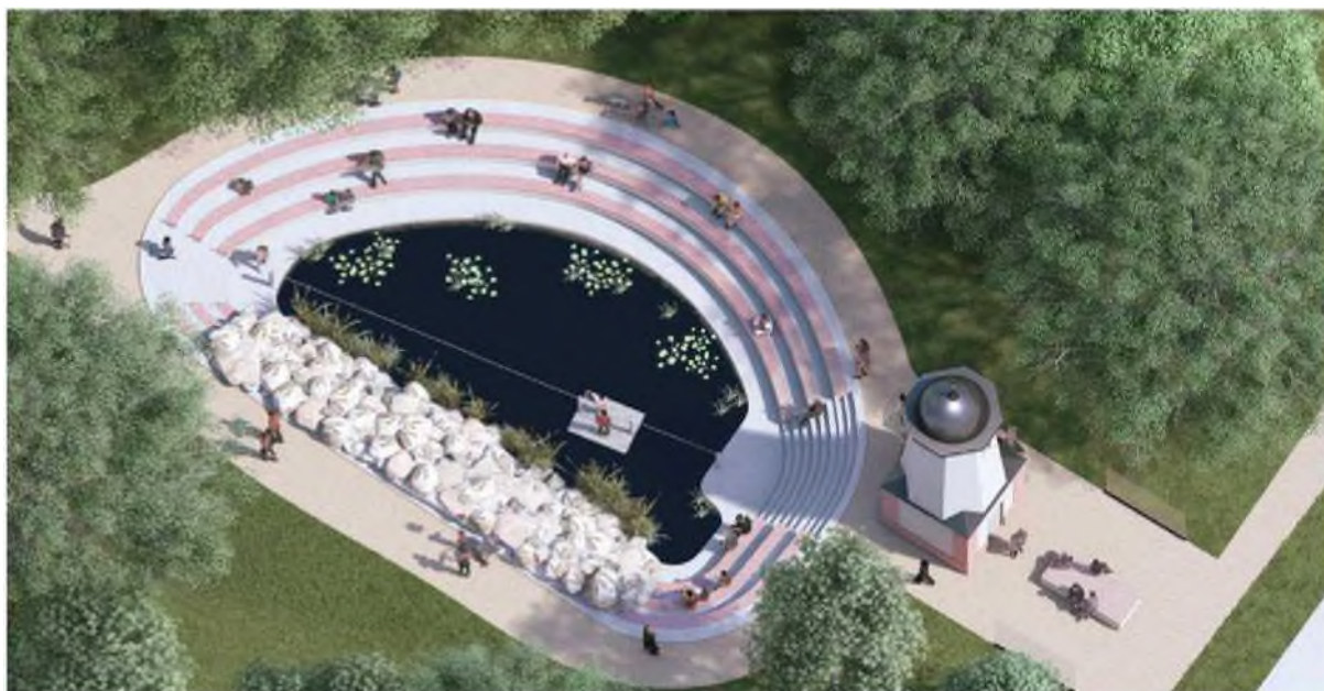
vybraná varianta řešení

Ke spolupráci na tomto úkolu jsme vyzvali naše specialisty, kteří se s obdobnými úlohami zabývají.