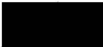
za poskytovatele Bc. Jiří Navrátil, MBA na základě pověření hejtmana kraje