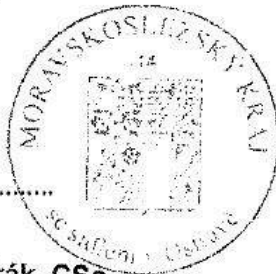
Table Tennis Club OSTRAVA 2016 s.r.o. 28. října 1727/108, 702 00 Ostrava IČO: 04818792, DIČ: CZ04818792