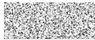
datum potvrzení a podpis dodavatele (razítko)