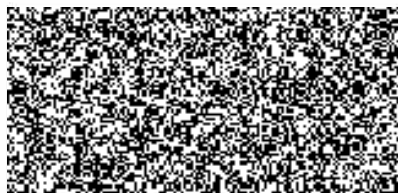
prodávající (razítko, podpis)