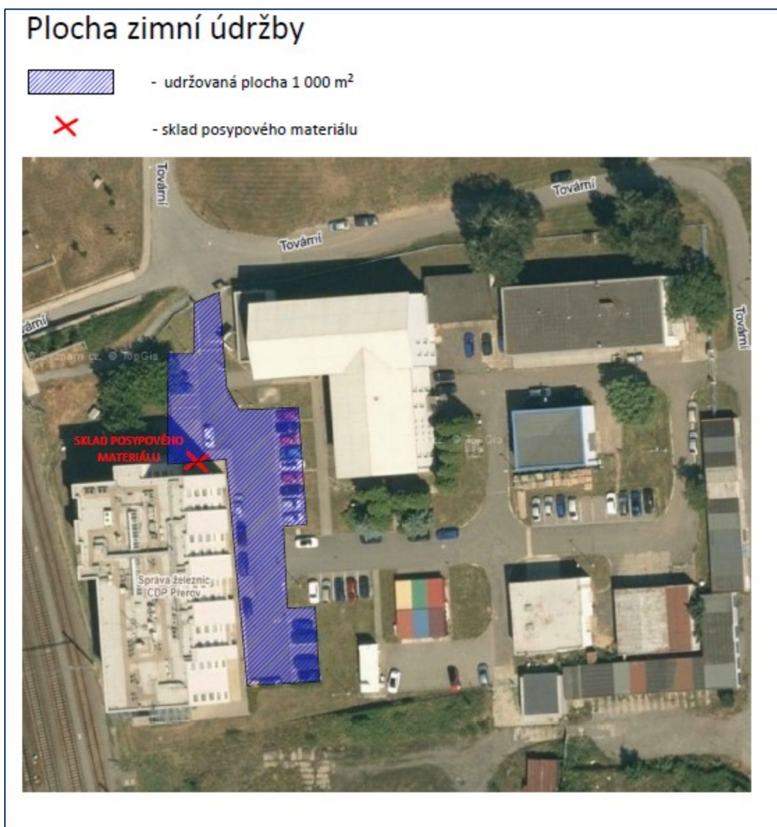
Obrázek 2 - Areál CDP Přešov – rozsah k bodu 1.43. TZ