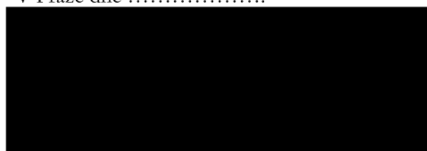
Výzkumný ústav Silva Taroucy pro krajinu a okrasné zahradnictví, v. v. i. Nájemce