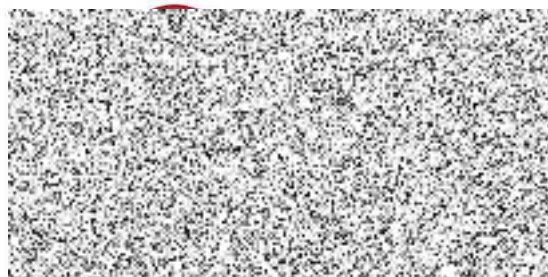
jednatel Safetech Pro s.r.o.