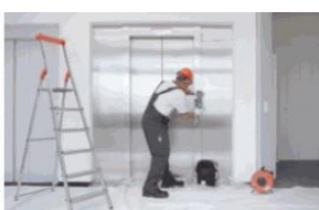
Servis 24 hodin