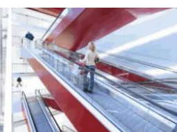
Eskalátory & pohyblivé chodníky