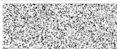
Objednatel (podpis a razítko)