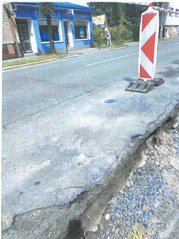
Plocha v místě stáv. vozovky pro nový asfalt. beton