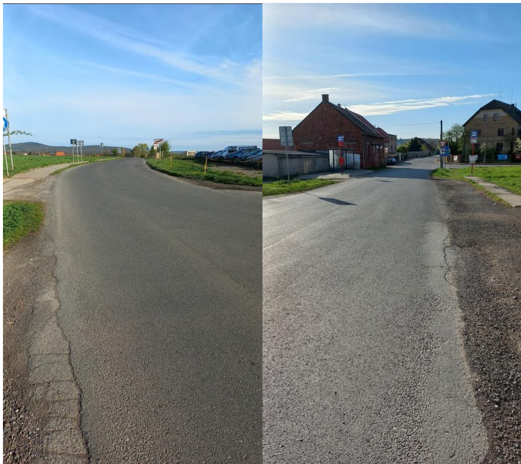
Zpracoval: Josef Raboch v dubnu 2024