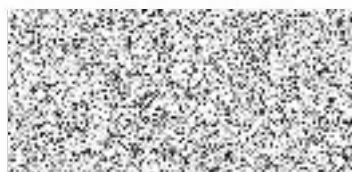
Kupující Aneta Malatová, na základě plné moci

Místo a datum podpisu V Praze, 15.7.2024