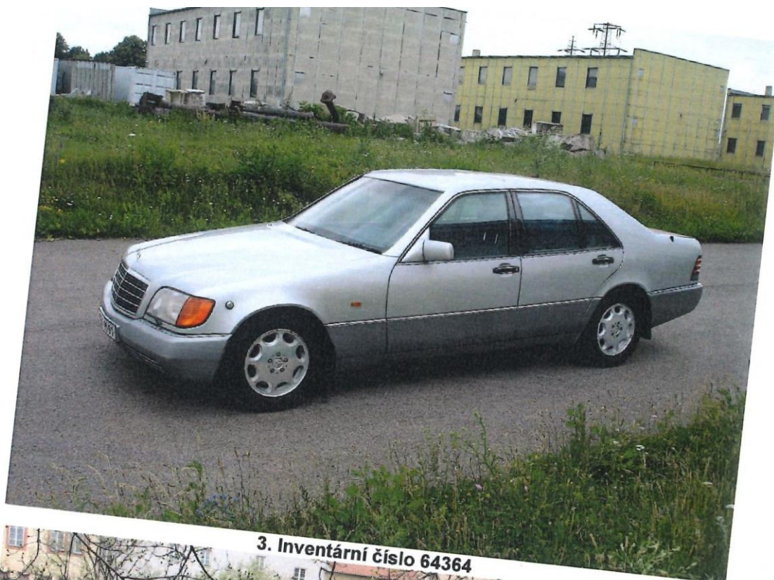
3. Inventární číslo 64364