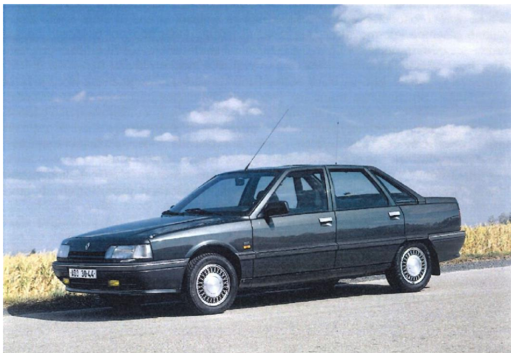
2. Inventární číslo 54493