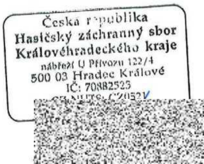
razítko a podpis objednatele