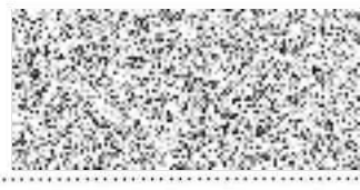
datum potvrzení a podpis dodavatele (razítko)