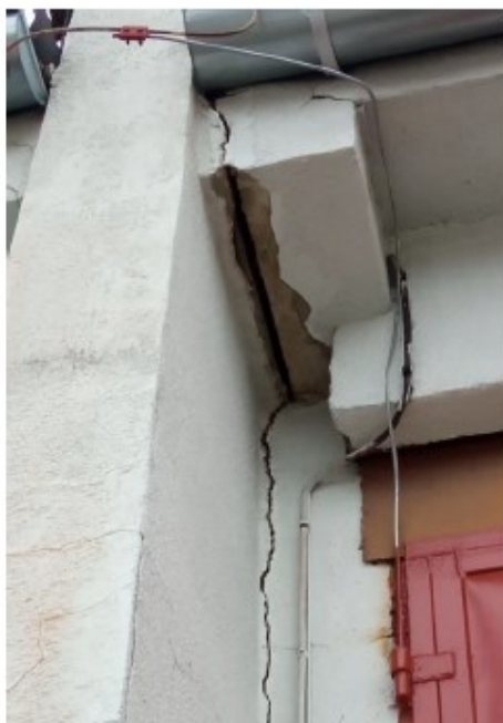
Lokální narušení zdiva