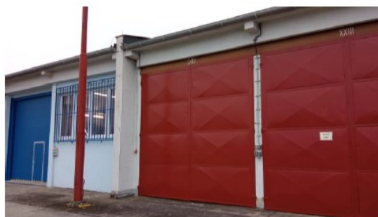
Stávající čelní fasáda/ vrata sousední symetrické části a řešené části