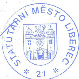
Tibor Batthyány primátor města