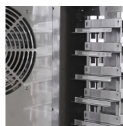
Vsuny na GN1/1 a Euronorm