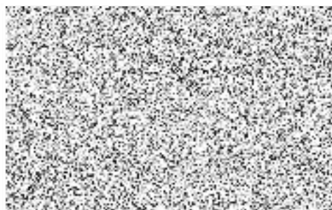
brig. gen. Ing. Miloslav Svatoš ředitel HZS Středočeského kraje vrchní rada

Česká republika Hasičský záchranný sbor Středočeského kraje Jana Palacha 1970 272 01 Kladno 2