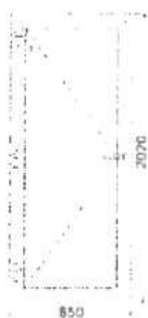
dveře ven otvíravé vnější pohled (exteriér)

Systém: REHAU SmartLine + Classic Barva výrobku: Bílá oboustranně Typ zasklení: Panel PVC bílý 24 mm (1) Kování: Winkhaus