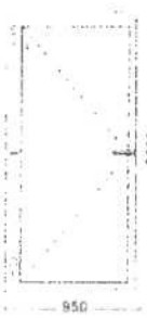
dveře ven otvíravé vnější pohled (exteriér)

Systém: REHAU SmartLine + Classic Barva výrobku: Bílá oboustranně Typ zasklení: Panel PVC bílý 24 mm (1) Kování: Winkhaus