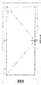
dveře vnitřní pohled (interiér)

Systém: REHAU SmartLine + Classic Barva výrobku: Bílá oboustranně Typ zasklení: Panel PVC bílý 24 mm (1) Kování: Winkhaus