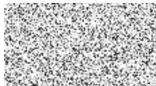
Prodávající Jednatel společnosti