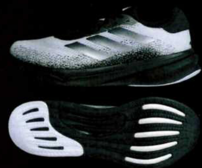
SUPERNOVA STRIDE M HC5483