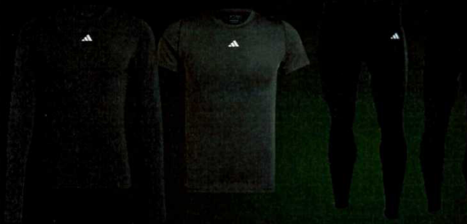
TF LS TEE M BLACK HK7649