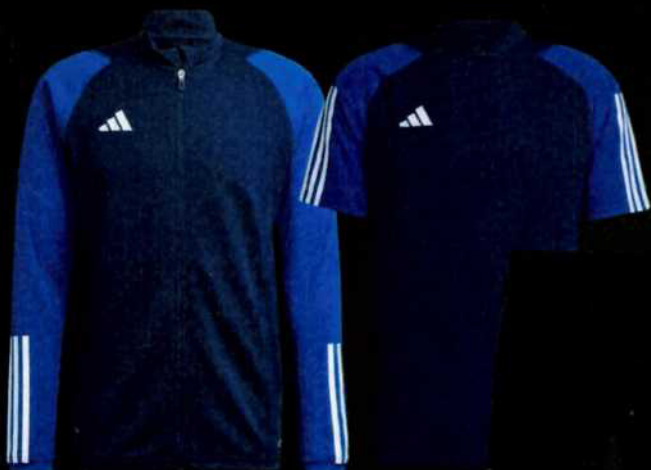
TIRO23 C TR JKT TENABL HK7649