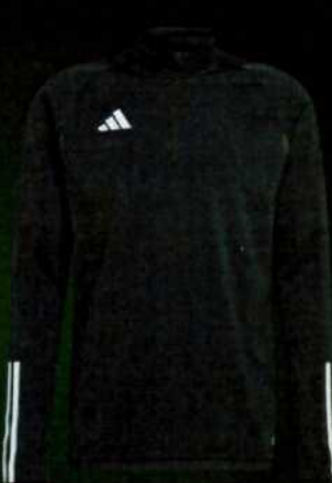
TIRO23 C TR TOP BLACK HK7644 nabídková cena 999 Kč vč. DPH/ks