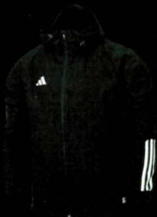
TIRO23 C AW JKT BLACK HK7656 nabídková cena 1.499 Kč vč. DPH/ks