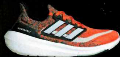
ULTRABOOST LIGHT BIRRED/CRYIAD ID3277