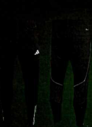
TIRO23 C TR PNT BLACK HC5483 nabídková cena 899 Kč vč. DPH/ks