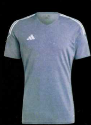
TIRO 23 JSY TMONIX/TMONIX IC7478 nabídková cena 529 Kč vč. DPH/ks