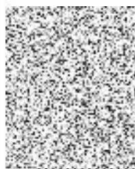
za zhotovitele Ing. Pavel Horáček

Nemocnice Vyškov, příspěvková organizace Purkyňova 36, 682 01 Vyškov tel.: 517 315 160 fax: 517 334 041 | 020