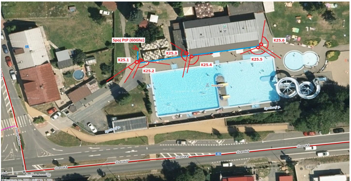
Kamera K25.2 až K25.6