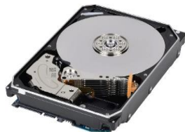
Disky HDD 16TB